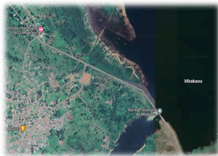
Figure 1 : Vue du barrage réservoir de Mbakaou et de la cité des exploitants

Le barrage de retenue de MBakaou se situe dans la localité de l'Adamaoua, rattaché dans la commune de Tibati dans le département du Djérem a été mis en service en juillet 1969, sur le fleuve Djérem affluent de la Sanaga. D'une capacité de 2,6 milliards de m 3 , il assure en période d'étiage, la régularisation du fleuve Sanaga afin d'optimiser les productions des barrages hydroélectriques de Song Loulou, Edéa et Nachtigal.