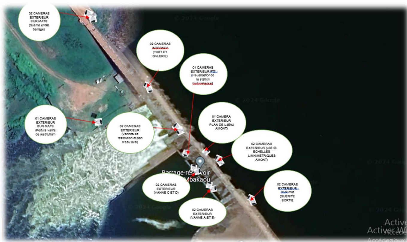
Figure 4 : Plan de surveillance du barrage de MBAKAOU